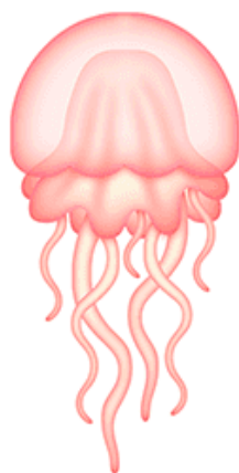
ЗА-ЗА-ЗА Прозрачная медуза