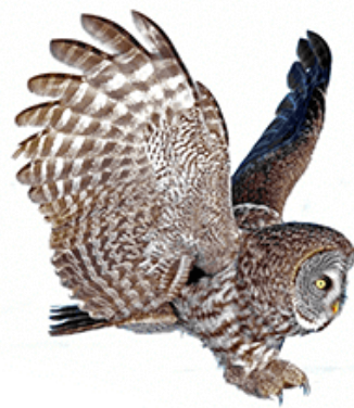
ВА-ВА-ВА К нам летит сова