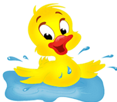
ДЕ-ДЕ-ДЕ Утенок плещется в воде